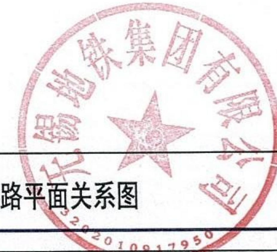
渔港路与听涛路交叉口东南侧地块与地铁线路平面关系图